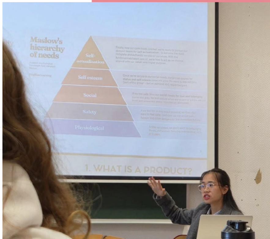
國際行銷：馬斯洛需求理論

國際行銷則以基礎的行銷知識、跨國的案例和主題報告來講解簡單的行銷方法。課堂中經常結合歐洲不同實例進行討論，老師也很鼓勵我們表達自己不同的想法，即便說錯了老師也會鼓勵並繼續講解。此外，除了期末報告外，也會有些簡單的小組分享，利用身邊的小物來練習如何做行銷，考驗我們對於國際行銷的觀念。與來自各國的同學共同交流，讓我更清楚國際行銷如何因文化以及消費者價值觀而有所差異。雖然實際上課時間有限，但課堂中的互動與討論，仍為我帶來相當深刻的學習經驗。